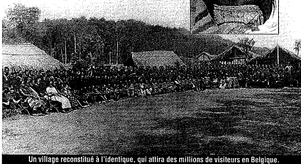
Un village reconstitué à l'identique, qui attira des millions de visiteurs en Belgique.

Replaçons-nous dans le contexte de l'époque. La Belgique, puissance coloniale, est soucieuse de prouver à la face du monde qu'elle aussi - avec l'appui des autorités et de l'Eglise - est capable de civiliser un peuple d'Afrique noire, les Congolais en l'occurrence. Non dénué d'objectifs politiques et économiques (rassurer les investisseurs et les banquiers), le projet frappe par son ampleur. Un mois de traversée houleuse sur le navire "L'Albertville", et plusieurs mois de séjour pour les 267 Congolais, débarqués à Anvers et installés dans un haras réaménagé à Tervuren, plusieurs villages noirs reconstitués, des scènes de la vie quotidienne rejouées (chants, danses, pêche...), un million de visiteurs... Richement documenté et très fouillé, le film de Francis Du-