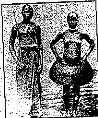
Couple de Congolais pour l'Exposition universelle de Bruxelles (1897)

□ Fin mai 1897, deux cent soixante-sept Congolais s'embarquent à destination de la Belgique afin d'être exhibés devant le million de visiteurs attendus à l'Exposition universelle de Bruxelles. Le roi Léopold II a voulu qu'ils soient les ambassadeurs de sa belle colonie. Au terme d'un voyage de quatre mois, ils subiront le regard écrasant des Blancs, la rigueur du climat, les maladies et, pour certains, la mort. Ces morts, jetés à la hâte dans une fosse commune, déclencheront une vive polémique dans la société belge.