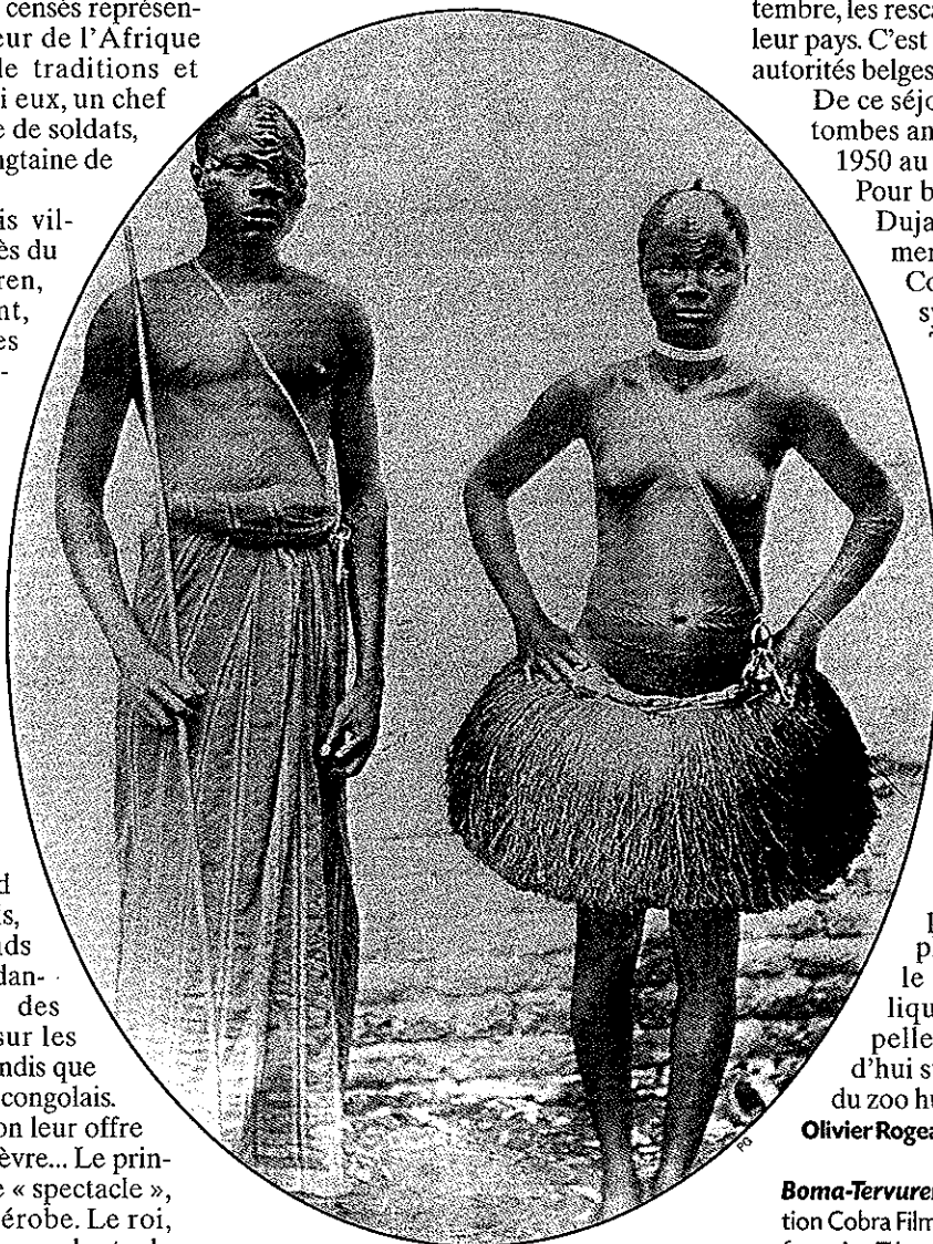
Parqués dans des villages reconstitués, les Congolais jouent des scènes de la vie quotidienne.

Eté 1897. Exhibés à l'Exposition universelle de Bruxelles, 267 Congolais vont subir le regard écrasant des Blancs, le froid, la maladie... Retour sur la terrible histoire de ce « zoo humain »