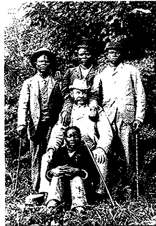
Boma - Tervuren, le voyage